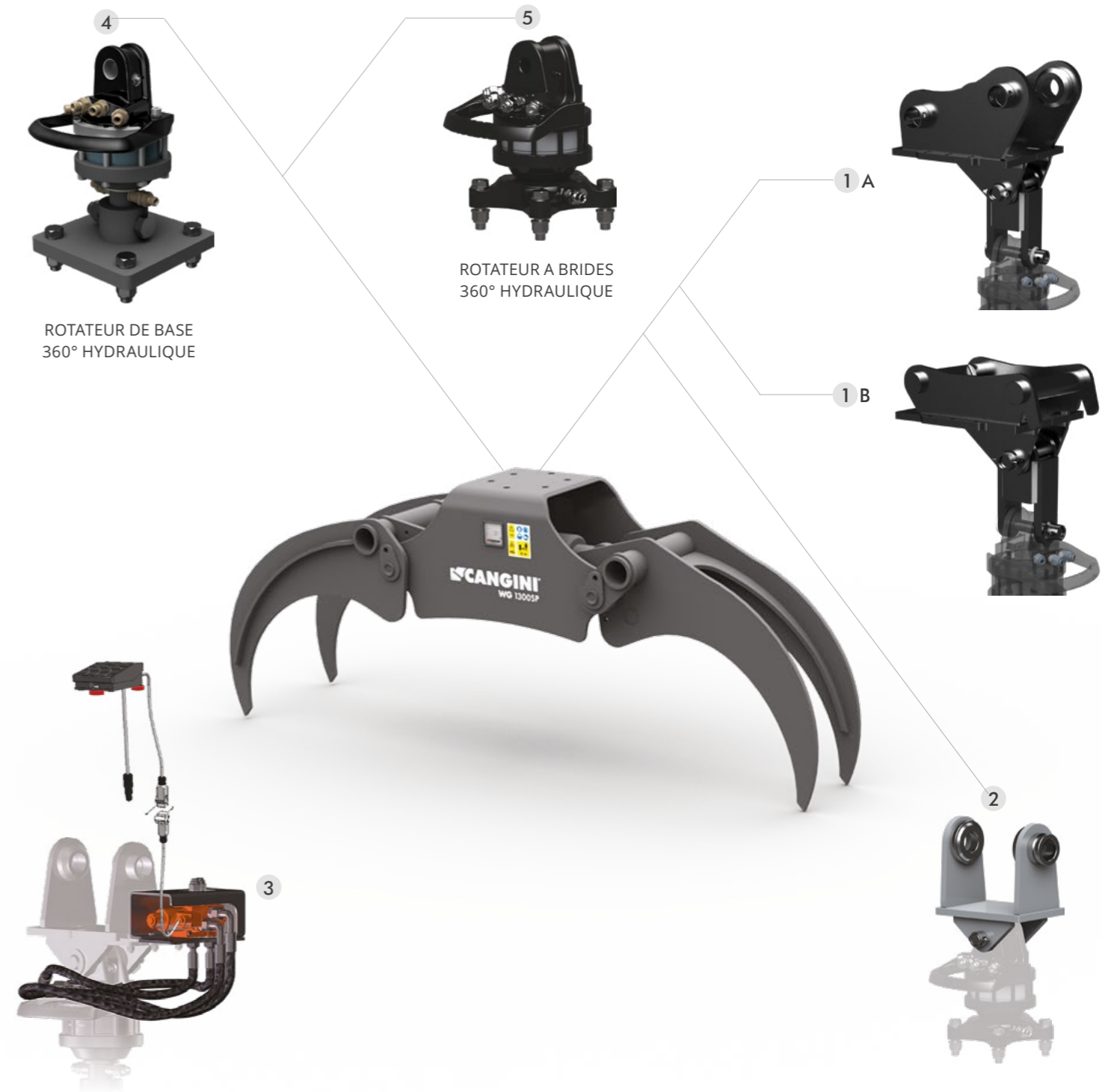
4 ROTATEUR DE BASE 360° HYDRAULIQUE